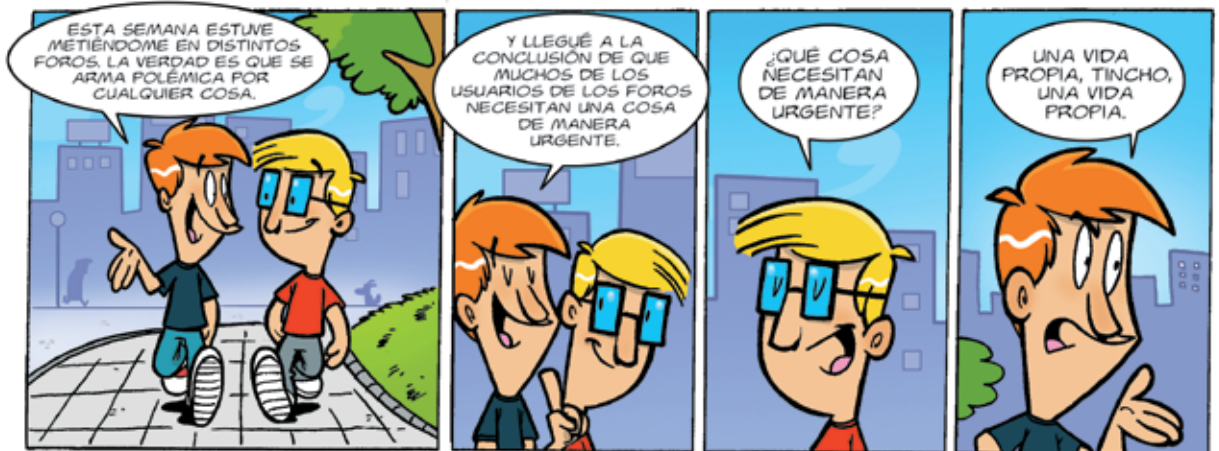
por El Bruno

✦ Favorecer la expresión de los jóvenes y los adolescentes en la construcción de acciones, programas y políticas que faciliten y garanticen el acceso efectivo a sus derechos.