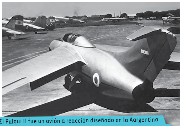
El Pulqui II fue un avión a reacción diseñado en la Argentina del que se construyeron cinco prototipos entre 1950 y 1959.

En 1930, comenzó una nueva etapa como consecuencia de la crisis económica mundial, que cerró los mercados internacionales y los destinos habituales del modelo agroexportador argentino. La Argentina hasta entonces vendía materias primas y alimentos, y compraba productos manufacturados y tecnología. La década del 30 fue una bisagra para el modelo productivo argentino. La ausencia de productos manufacturados para importar y la disminución de los mercados a los cuales vender las materias primas obligaron al país a producir sus propias manufacturas. A partir de este momento, comenzó un lento